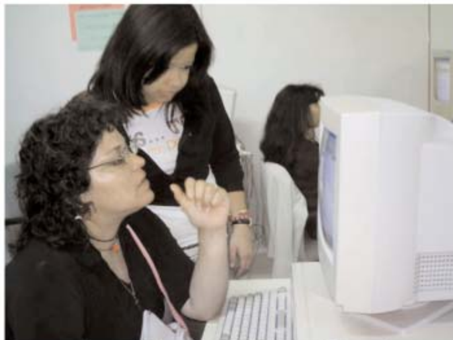
Alumna y profe en unos de los cursos de ordenadores del Conecta Joven.

cación social y desarrollo personal del joven y, por otra, la garantía de que cualquier persona, independientemente de su edad o formación, tenga la oportunidad de acceder a las nuevas tecnologías.